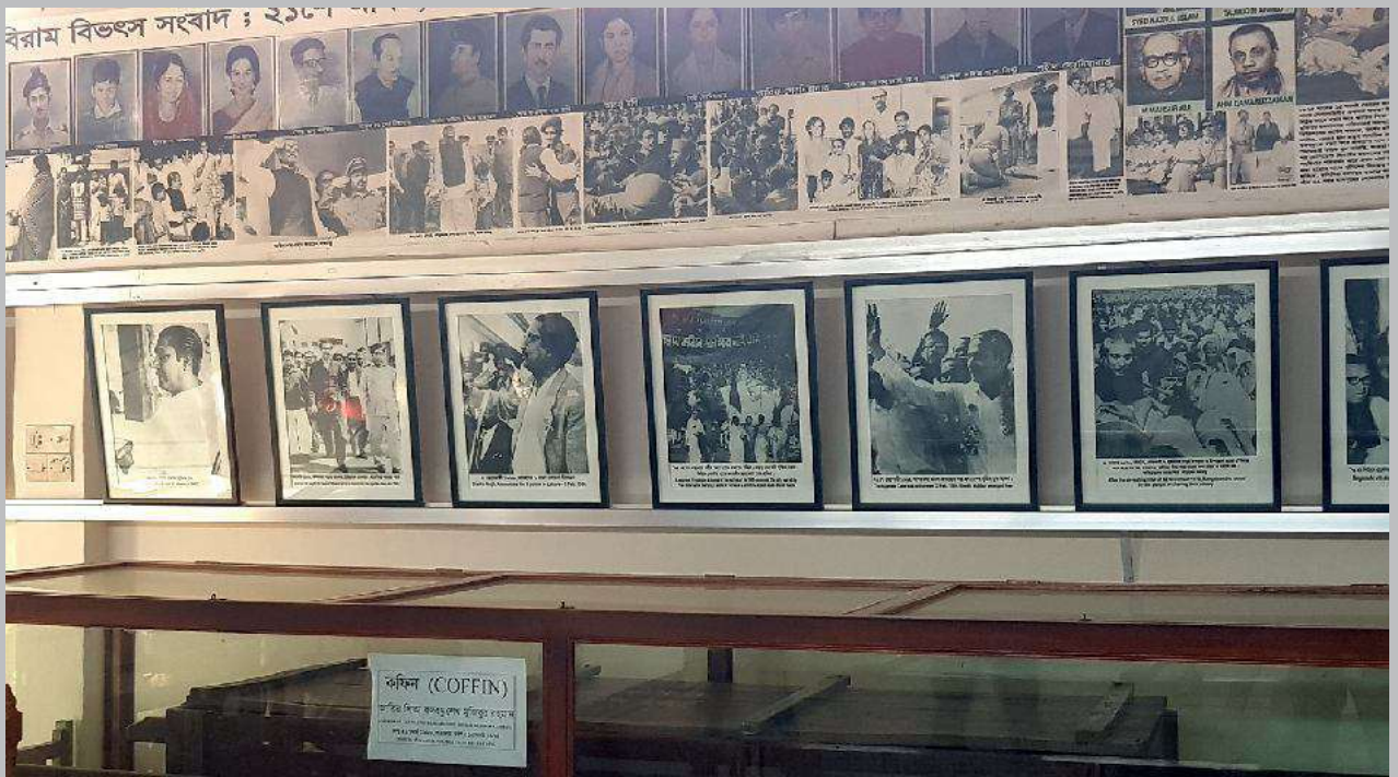
সমাধিসৌধ যাদুঘরের দ্বিতীয় তলায় রক্ষিত আছে বঙ্গবন্ধুর কফিন Coffin of Bangbandhu at 1 st Floor at the Museum of the Mausoleum