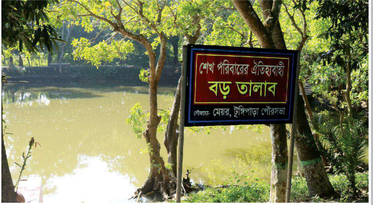
জাতির পিতার পরিবারের ব্যবহৃত বড় তালাব (পুকুর)