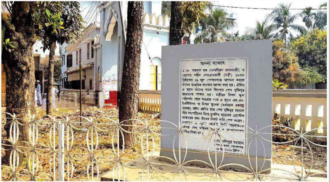
ঐতিহাসিক কোর্ট মসজিদ মোড়। তদানীন্তন মুখ্যমন্ত্রী শের-এ-বাংলা এ.কে ফজলুল হক এবং হোসেন শহীদ সোহরাওয়ার্দী ১৯৩৮ সালে মথুরানথ ইনস্টিটিউট মিশন স্কুল পরিদর্শনকালে স্কুল ছাত্র শেখ মুজিব হোস্টেল ছাদ সংস্কারের দাবীতে এখানে তাদের পথ রোধ করেন। Historic Court Mosque Moore. In 1938 during the inspection of Mathuranath Institute Mission School the then Chief Minister Sher-E-Bangla A.K. Fazlul Haque and Huseyn Shaheed Suhrawardy were stopped here by student Sheikh Mujib demanding the repairing of the damaged hostel roof.

কৃতজ্ঞতা স্বীকার: জেলা ব্র্যান্ডিং গোপালগঞ্জ