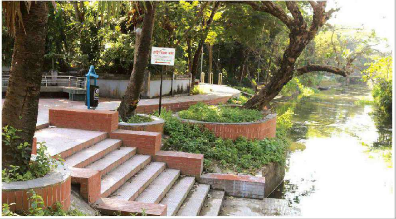
ঐতিহাসিক হিজল তলা (এই ঘাটে জাতির পিতা শৈশবে গোসল করতেন) Historic Hijal Tala where Bangbandhu used to take bath in his childhood