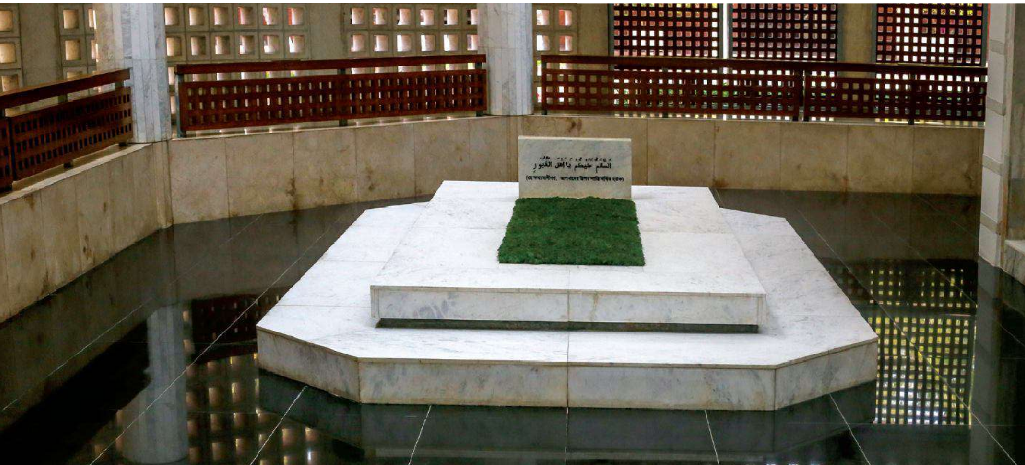
জাতির পিতা বঙ্গবন্ধু শেখ মুজিবুর রহমানের সমাধি Place of eternal rest of Father of the Nation Bangabandhu Sheikh Mujibur Rahman

জাতির জনক বঙ্গবন্ধু শেখ মুজিবুর রহমান FATHER OF THE NATION BANGABANDHU SHEIKH MUJIBUR RAHMAN ১ ২ ৩ ৪ ৫ ৬ ৭ ৮ ৯ ১০ ১১ ১২ ১৩ ১৪ ১৫ ১৬ ১৭ ১৮ ১৯ ২০ ২১ ২২ ২৩ ২৪ ২৫ ২৬ ২৭ ২৮ ২৯ ৩০ ৩১ ৩২ ৩৩ ৩৪ ৩৫ ৩৬ ৩৭ ৩৮ ৩৯ ৪০ ৪১ ৪২ ৪৩ ৪৪ ৪৫ ৪৬ ৪৭ ৪৮ ৪৯ ৫০ ৫১ ৫২ ৫৩ ৫৪ ৫৫ ৫৬ ৫৭ ৫৮ ৫৯ ৬০ ৬১ ৬২ ৬৩ ৬৪ ৬৫ ৬৬ ৬৭ ৬৮ ৬৯ ৭০ ৭১ ৭২ ৭৩ ৭৪ ৭৫ ৭৬ ৭৭ ৭৮ ৭৯ ৮০ ৮১ ৮২ ৮৩ ৮৪ ৮৫ ৮৬ ৮৭ ৮৮ ৮৯ ৯০ ৯১ ৯২ ৯৩ ৯৪ ৯৫ ৯৬ ৯৭ ৯৮ ৯৯ ১০০ জন্ম: বুধবার ৪ চৈত্র, ১৩২৬ বাং ১৭ ই মার্চ, ১৯২০ ইং ২৫ লে জমাদিয়াস্ সানি, ১৩৩৮ হিজ শাহাদাত বরণ: শুক্রবার ২১ লে শ্রাবন, ১৩৮২ বাং ১৫ ই আগস্ট, ১৯৭৫ ইং ৭ ই শাবান, ১৩৯৫ হিজ Birth: Wednesday 4th Chaitra, 1326 BS 17th March, 1920 25th Jamadius Sani 1338 Hizri Martyred: Friday 29th Sraban, 1382 BS 15th August, 1975 7th Shaban, 1395 Hizri