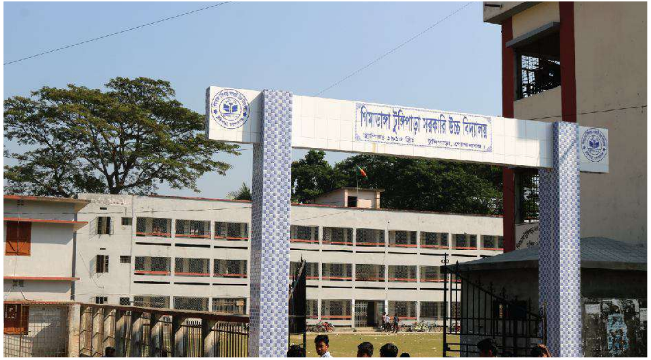
বঙ্গবন্ধুর শৈশবের বিদ্যানিকেতন গিমাডাঙ্গা টুঙ্গিপাড়া সরকারি উচ্চ বিদ্যালয় (বর্তমান অবস্থা) Gimadanga Tungipara Govt. High School (present status)