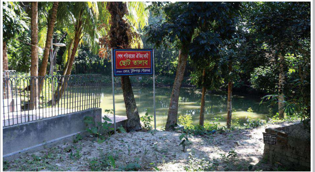
জাতির পিতার পরিবারের ঐতিহাসিক ছোট তালাব Historic Small Pond of the family of Father of the Nation