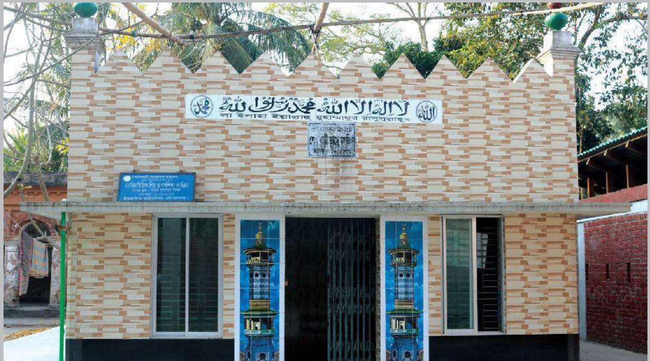
১৮৫৪ সালে প্রতিষ্ঠিত শেখ পরিবারের ঐতিহাসিক মসজিদ (সংস্কারের পর বর্তমান অবস্থা) Historic Mosque of the Sheikh Family founded in 1884. (present status after renovation)