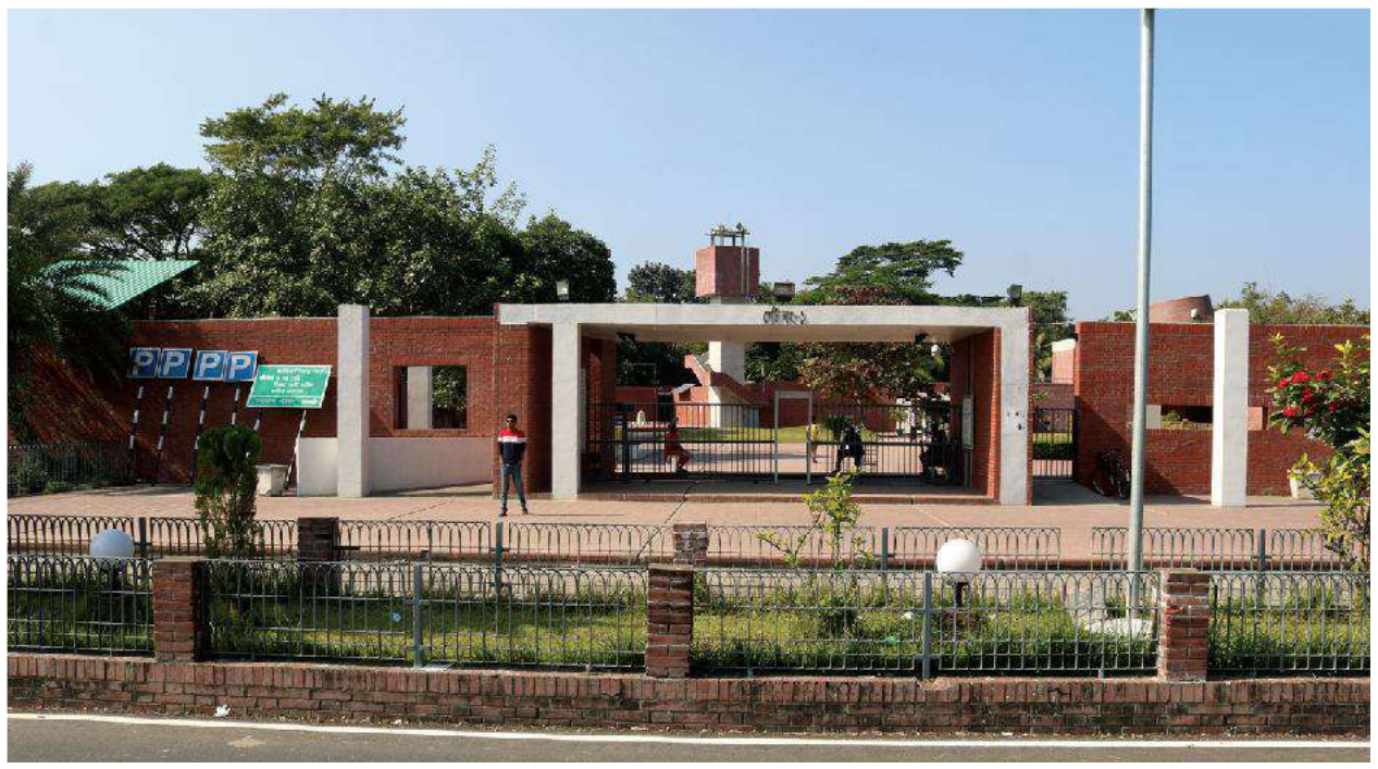
বঙ্গবন্ধু সমাধিসৌধ কমপ্লেক্সের মূল ফটক | Main Entrance Of the Mausoleum of Father of the Nation