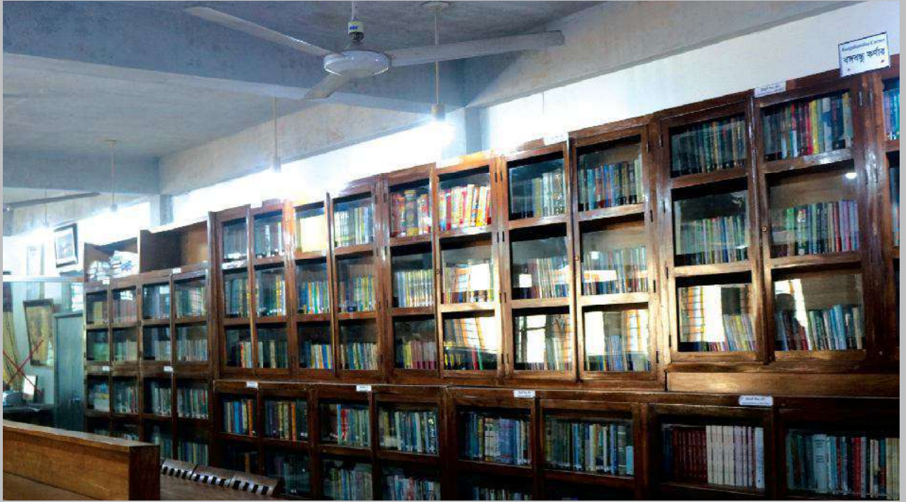
জাতির পিতার সমাধিসৌধের সুদৃশ্য লাইব্রেরির খন্ডিত অংশের চিত্র Partial picture of beautiful library of Mausoleum of the Father of the Nation