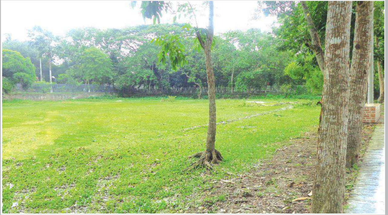
জাতির পিতার বাল্যকালের খেলার মাঠ | Childhood playground of Father of the Nation