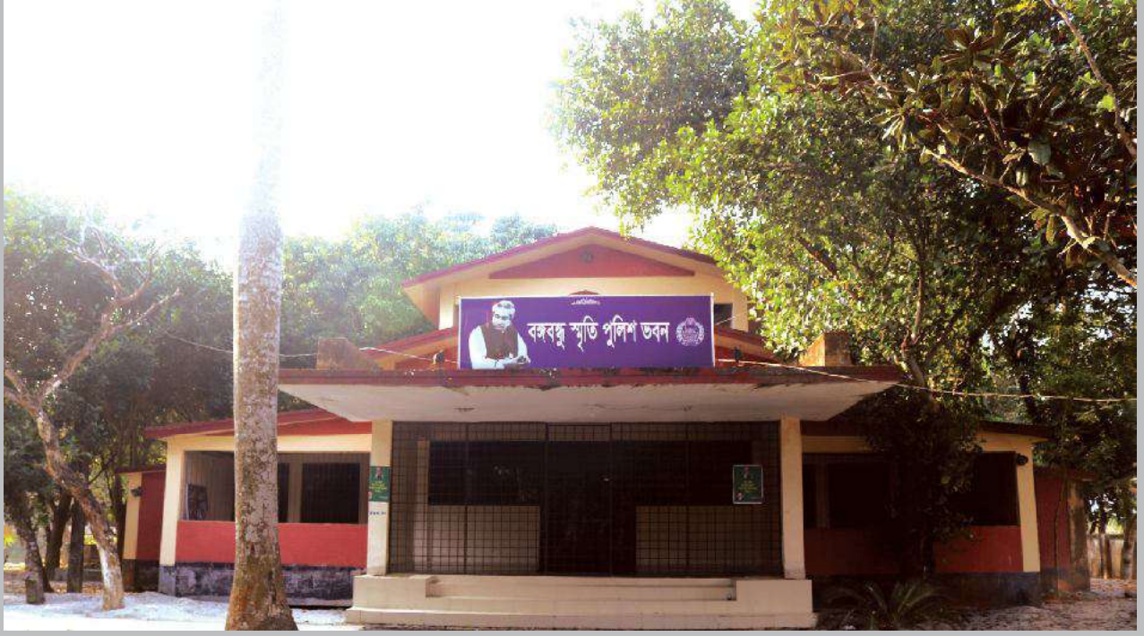
বঙ্গবন্ধুর স্মৃতি বিজড়িত জেলা পরিষদ ভবন। বঙ্গবন্ধু টুঙ্গিপাড়া এলে নেতা কর্মীদের নিয়ে এখানে মিটিং করতেন। বর্তমানে এটি বঙ্গবন্ধু স্মৃতি পুলিশ ভবন হিসেবে ব্যবহৃত হচ্ছে। District Council Building where Bangabandhu used to attend meeting with the leaders during his stay at Tungipara. Now it is used as Bangabandhu Memorial Police House.